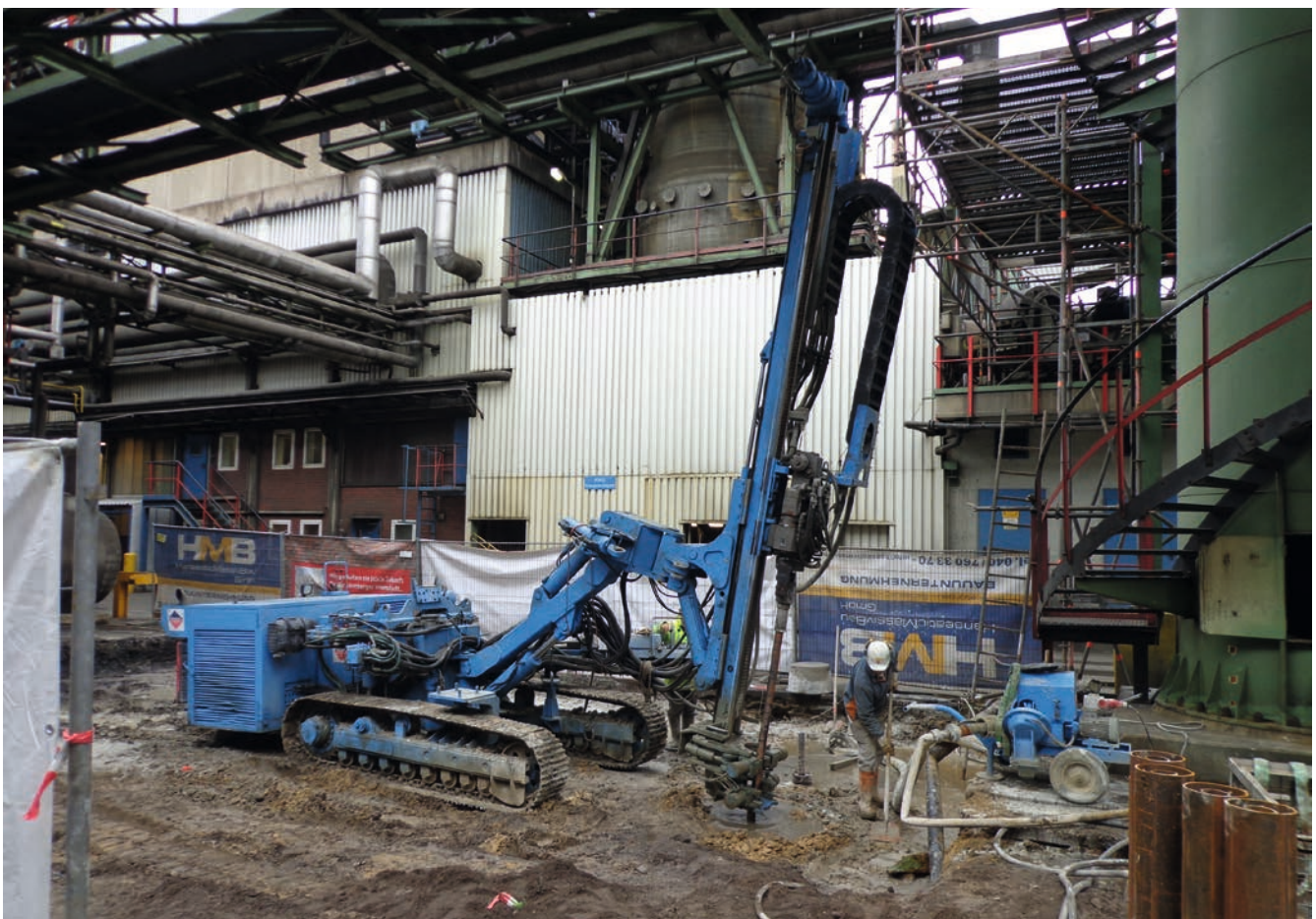
Bild 3: Einbohren eines TITAN Pfahls unter begrenzten Höhenverhältnissen